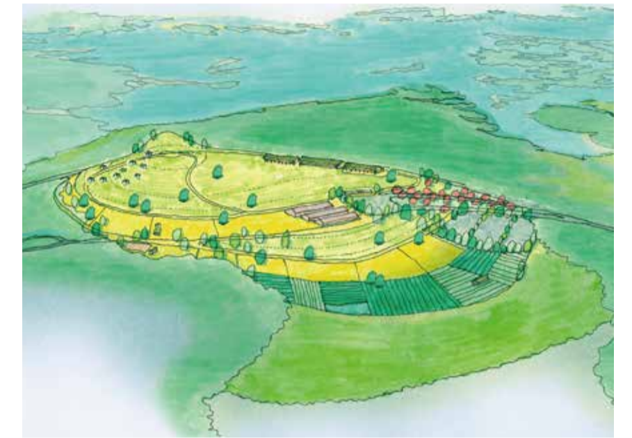
「丘」をコンセプトにした観光公園のイメージ

です。そのためには、今回発足したチーム俵や各部の事業を通して地元としてできることを増やし、1つずつ成果を出していくことが道を拓きます。地元が一丸となって取り組みを進めていきましょう！